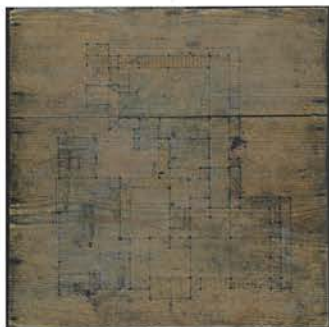
木板图(重要文化财产)

杉木板上画的是旧中筋家住宅主屋的平面图。这图可能是当初的建筑设计图。从主屋屋脊兽面瓦上用刮刀刻的文字中了解,这主屋是建筑于嘉永5年(1852)。