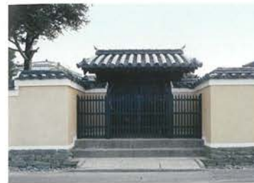
御成门(门第高贵者进出的门)