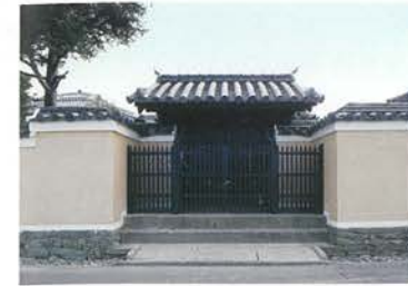
오나리문 (명가에서 귀인을 맞이하는 문)

그외 저택지 내에는 미 지정 문화재의 된장 만드는 곳, 다실이나 인력거 차고 등이 있습니다.