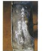
본가 도깨비기와 도깨비기와에는 “嘉永五年 彌宜村 瓦屋新兵衛”라고 쇠주격으로 써 있습니다.