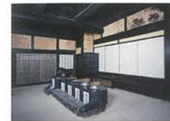
토방의 부뚜막 본가의 토방에는 당초에 있던 부뚜막을 재현했습니다. 아궁이가 5개로 한 줄로 늘어서 있습니다.

오모야(본가) 카에이5년(1852)건축된 본가는 폭이22.8미터 안길이가25미터의 큰 건물입니다. 평면형은 일부3층건물로 취합부를 사이에 두고 서쪽 토방과 부엌, 북쪽으로 다다미20장 정도의 넓은 방, 동쪽으로 다다미방이 배치되어 있습니다.