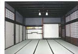
오모히로마(넓은 방) 넓은 방은 기주변으로부터의 사신이나 손님 등을 대접하는 방으로서 사용되었습니다.